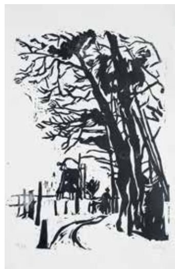
Bild: Weg zur Windmühle, Linolschnitt

So. 19.11. | 17.00 Uhr | Galerie im Kloster